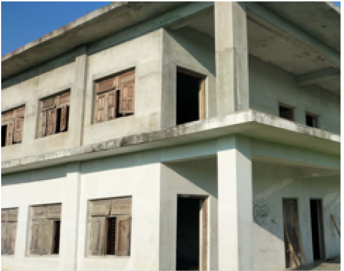
गौशाला ईन्जिनियरिङ्ग कलेजको भवन